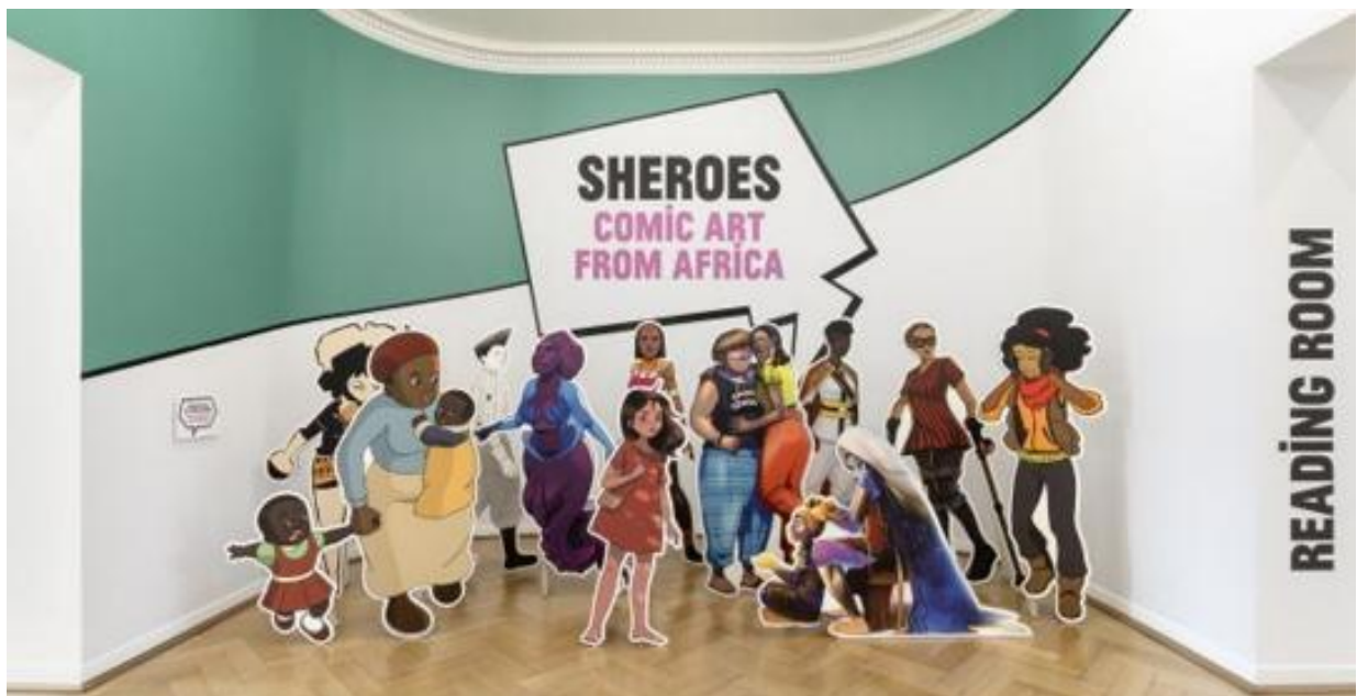
Ausstellungsansicht „SHEROES. Comic Art from Africa“.