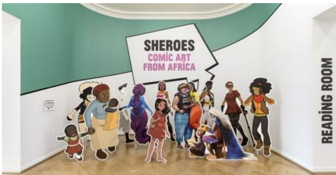
Ausstellungsansicht „SHEROES. Comic Art from Africa“.