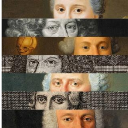
Bildnachweis: Ausschnitte aus ausgestellten Werken

Highlight ist ein 3D-Rundgang, der ein virtuelles Erleben aller 13 Räume dieser Sonderausstellung