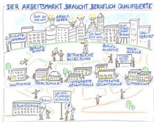
Die Poster wurden von Frau Kinga Wagner ( www.p-spe.de ) gezeichnet.

Ausgehend von der Vielfalt der Wege zu berufsqualifizierenden Schulabschlüssen wird dargestellt, was es für einen qualifizierten Auftritt auf den Arbeitsmarkt braucht. Es wird auf die raschen Veränderungen des Arbeitsmarktes hingewiesen und auf die Notwendigkeit des lebenslangen Lernens aufmerksam gemacht. Schließlich werden die Unterschiede der Arbeitsverhältnisse, Arbeitsbedingungen und Einstiegsgehälter aufgezeigt, die akademische und nicht akademische Fachkräfte auf dem Arbeitsmarkt vorfinden werden.