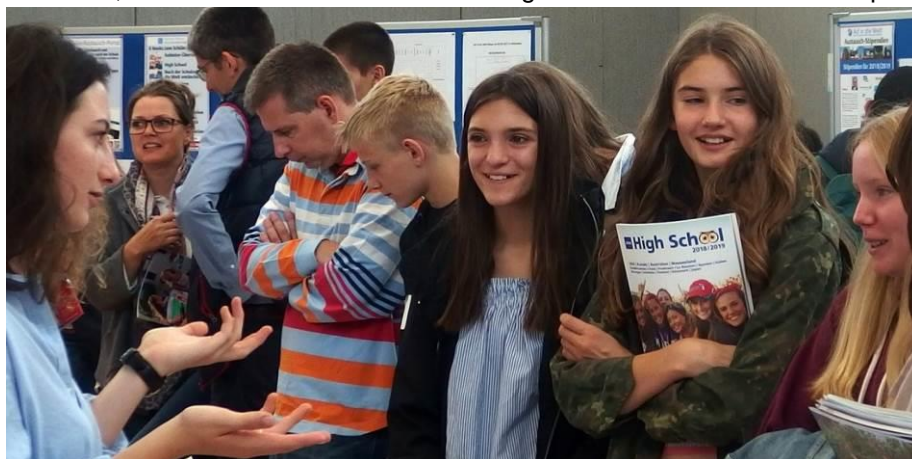
Gute Beratung bei der AUF IN DIE WELT-Messe in Wiesbaden

Ob USA, Kanada, Neuseeland oder Australien: Die Bewerbungsphase für 2019 läuft. Die gemeinnützige Stiftung Völkerverständigung bietet allen Schülern, Familien und Pädagogen die Chance zur umfassenden, aktuellen Information über die Angebote und die Austausch-Stipendien.